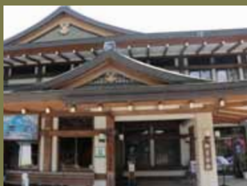
嵐電「御室仁和寺」駅下車徒歩約5分